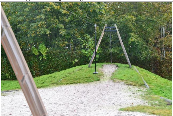
Redskab: Svævebane Årgang: 2016 Producent: Lappset Er redskabet mærket: Ja Er der registreret fejl/mangler: