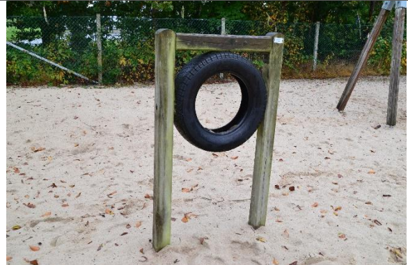
Redskab: Klatredæk Årgang: 2008 Producent: Egen produktion Er redskabet mærket: Ja Er der registreret fejl/mangler: Nej