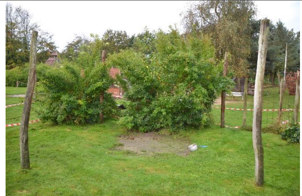
Redskab: Læsejlsstolper Årgang: Producent: Er redskabet mærket: Nej Er der registreret fejl/mangler: Nej