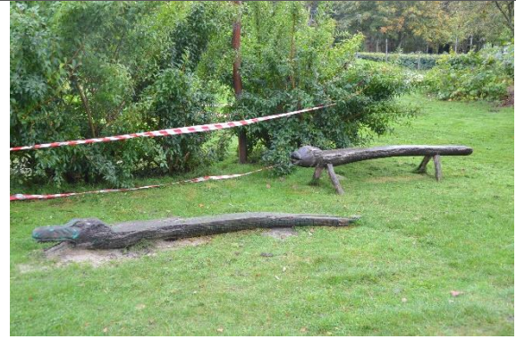
Redskab: Klatredyr Årgang: Producent: Er redskabet mærket: Nej Er der registreret fejl/mangler: Nej