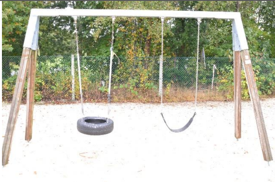
Redskab: Gyngestativ Årgang: 2010 Producent: Lekolar/Rudeco Er redskabet mærket: Ja Er der registreret fejl/mangler: Ja