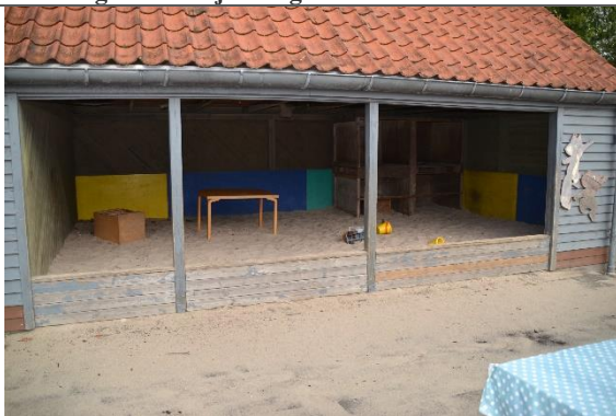
Redskab: Sandkasse Årgang: Producent: Er redskabet mærket: Nej Er der registreret fejl/mangler: Nej