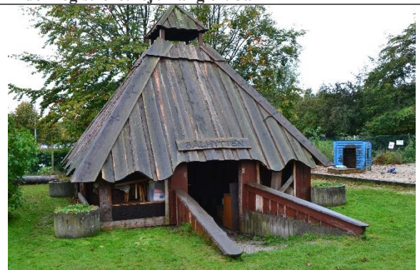
Redskab: Bålhytte Ikke omfattet af DS/EN 1176