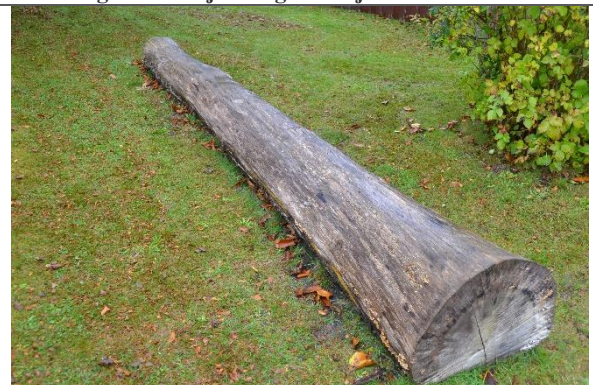
Redskab: Klatrestamme Årgang: Producent: Er redskabet mærket: Nej Er der registreret fejl/mangler: Nej