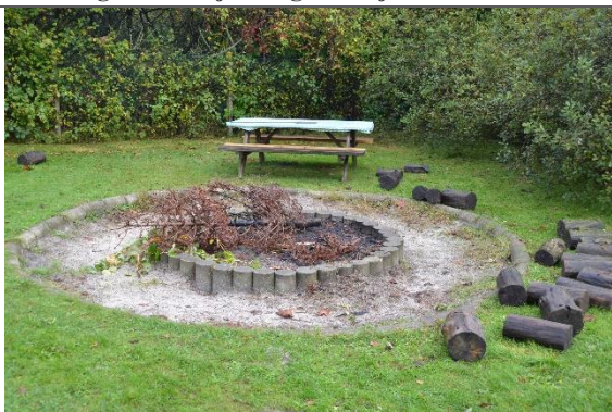
Redskab: Bålsted Ikke omfattet af DS/EN 1176