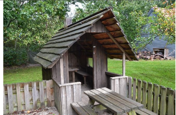
Redskab: Legehus Årgang: 2008 Producent: Egen produktion Er redskabet mærket: Ja Er der registreret fejl/mangler: Nej