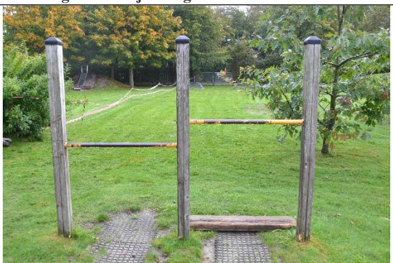
Redskab: Svingbom Årgang: 2010 Producent: Lekolar/Rudeco Er redskabet mærket: Ja Er der registreret fejl/mangler: