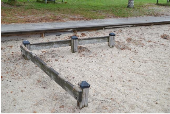
Redskab: Balancegang Årgang: Producent: Er redskabet mærket: Nej Er der registreret fejl/mangler: NEJ