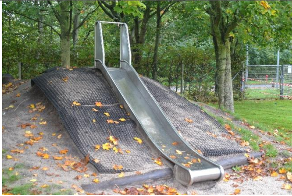
Redskab: Terrænruksjebane Årgang: Producent: Er redskabet mærket: Nej Er der registreret fejl/mangler: Ja