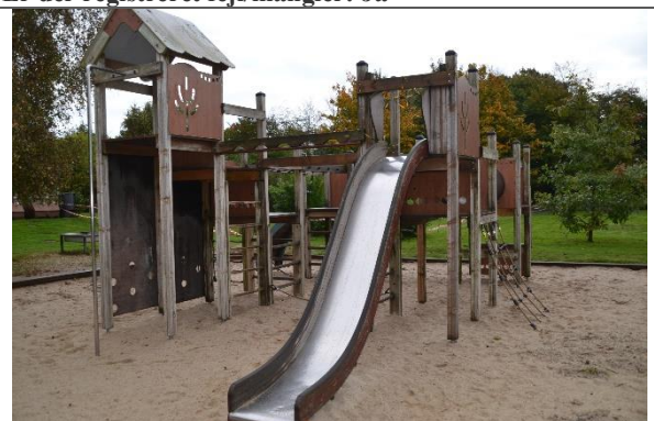
Redskab: Klatrestativ med rutsjebane Årgang: Producent: Er redskabet mærket: Nej Er der registreret fejl/mangler: Ja