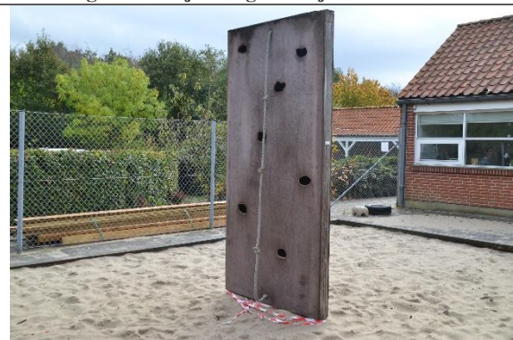
Redskab: Klatrevæg Årgang: 2004 Producent: Egen produktion Er redskabet mærket: Ja Er der registreret fejl/mangler: Ja