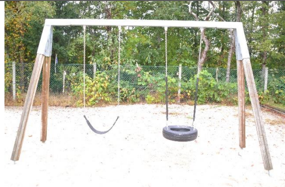
Redskab: Gyngestativ Årgang: 2010 Producent: Lekolar/Rudeco Er redskabet mærket: Nej Er der registreret fejl/mangler: Nej