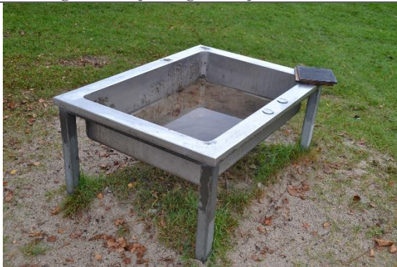
Redskab: Vandleg Årgang: Producent: Er redskabet mærket: Nej Er der registreret fejl/mangler: Nej