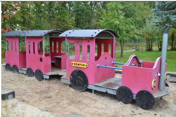
Redskab: Legetog Årgang: Producent: Kompan Er redskabet mærket: Ja Er der registreret fejl/mangler: Nej