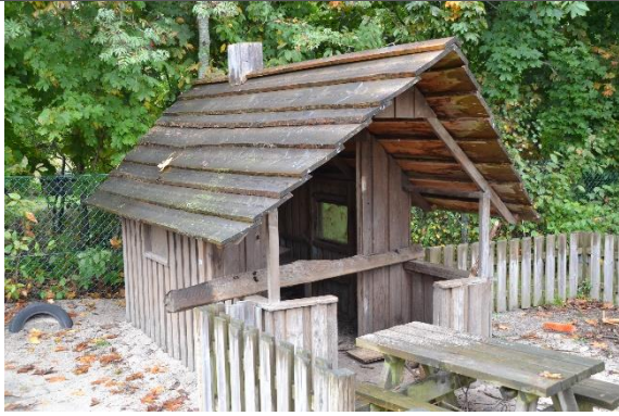
Redskab: Legehus Årgang: 2008 Producent: Egen produktion Er redskabet mærket: Ja Er der registreret fejl/mangler: Ja