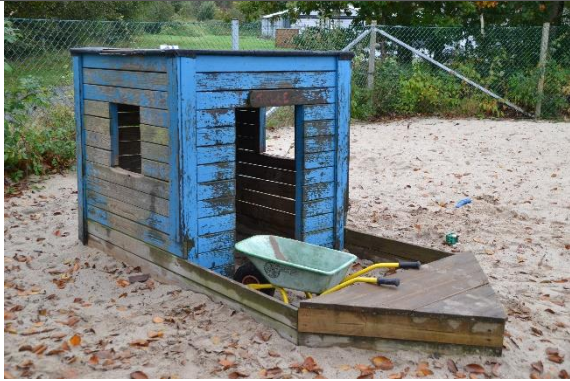
Redskab: Legeskib Årgang: 2014 Producent: Egen produktion Er redskabet mærket: Ja Er der registreret fejl/mangler: Ja