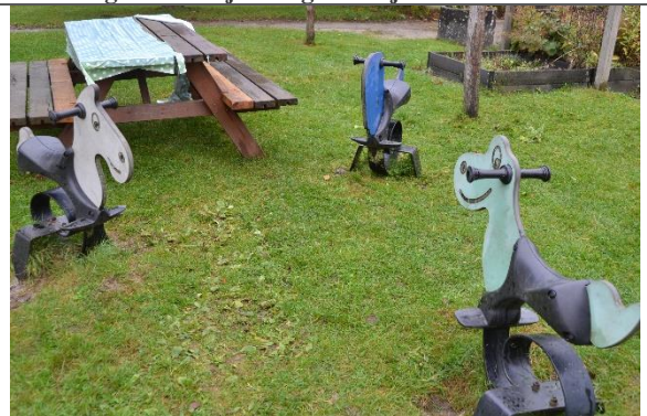
Redskab: Vippedyr Årgang: Producent: Er redskabet mærket: Nej Er der registreret fejl/mangler: Ja