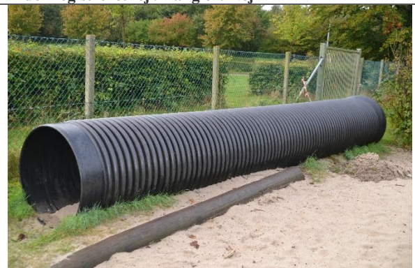
Redskab: Tunnel Årgang: Producent: Er redskabet mærket: Nej Er der registreret fejl/mangler: Ja