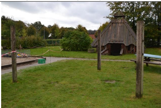
Redskab: Læsejlsstolper Årgang: Producent: Er redskabet mærket: Nej Er der registreret fejl/mangler: Nej