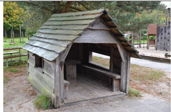
Redskab: Legehus Årgang: Producent: Er redskabet mærket: Nej Er der registreret fejl/mangler: Nej